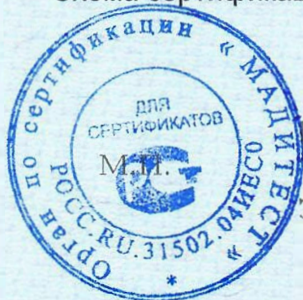
Схема сертификации 1с