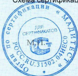
Схема сертификации 1с